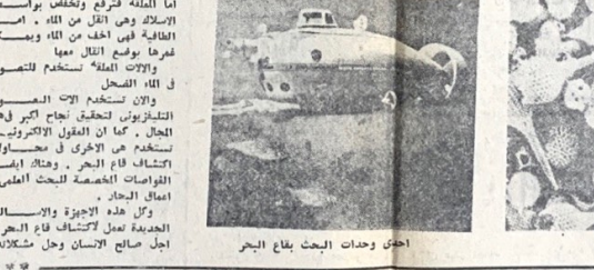
احدى وحدات البحث بلاغ الحجر

البريطانية الجنوبية والخرية ، ومنذ ايام في الثلث من المنسوس ، وهي وود احتياض بتروك كيرل في هذه التانق ..