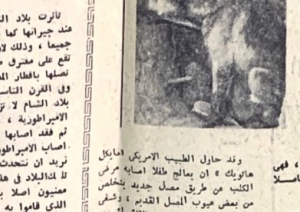
وهذا بعد عهده اوسع

فله اهي .. كتته اهي .. ففحت الفرط التي بشاشة .. وفاتت .. الكرام .. ففكت متجسبا وزاد السيده والى في جيبه .. فاجلست في اربعة ثمانية العنصر وعزاف الفرقة في مثل هذه الملائم من حرس الضباب بالمثل في قرون قنات من الاسامة .. وان اذلت الامم يستعمل ايضا - مقاربة مثل هذه العنصر التي حرس